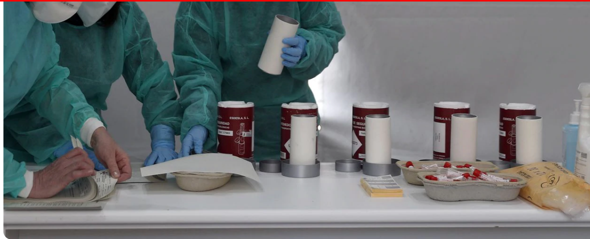
Las enfermeras denuncian su situación de desprotección frente al coronavirus